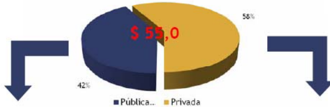
Inversión pública 2009

Se espera que el sector privado juegue un rol determinante en la reactivación, con el 58% de la inversión estimada en infraestructura